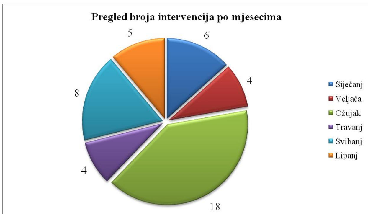
Graf 1. - Prikaz broja vatrogasnih intervencija po mjesecima

Nastanak intervencija po mjesecima prikazan je u grafičkom prikazu br.1.